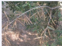
4. RAMI DA GIARDINO