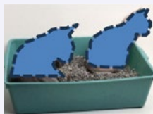
6. CONTENUTO VEGETALE DELLE LETTIERE PER GATTI