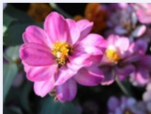
5. FIORI (esclusi: vasi, terra, materiali, composi- zioni floreali)