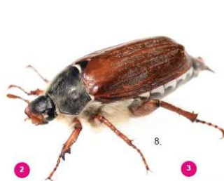
2 Melolontha melolontha Il comune maggiolino, 25-30 mm, non possiede ciuffi bianchi.