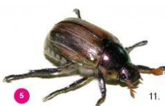
5 Mimela junii Il giugnino Mimela junii , 13-16 mm, possiede elitre di colore verde dorato e molti peli diffusi che non si distinguono in ciuffi bianchi. Ha una forma più ovale rispetto al coleottero giapponese.