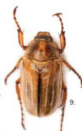
3 Amphimallon solstitiale Il maggiolino di San Giovanni ( Amphimallon solstitiale ), 14-20 mm, e il maggiolino europeo ( Amphimallon majalis ), 11-14 mm, non hanno ciuffi bianchi, possiedono elitre color bruno rossastro e pronoto scuro.