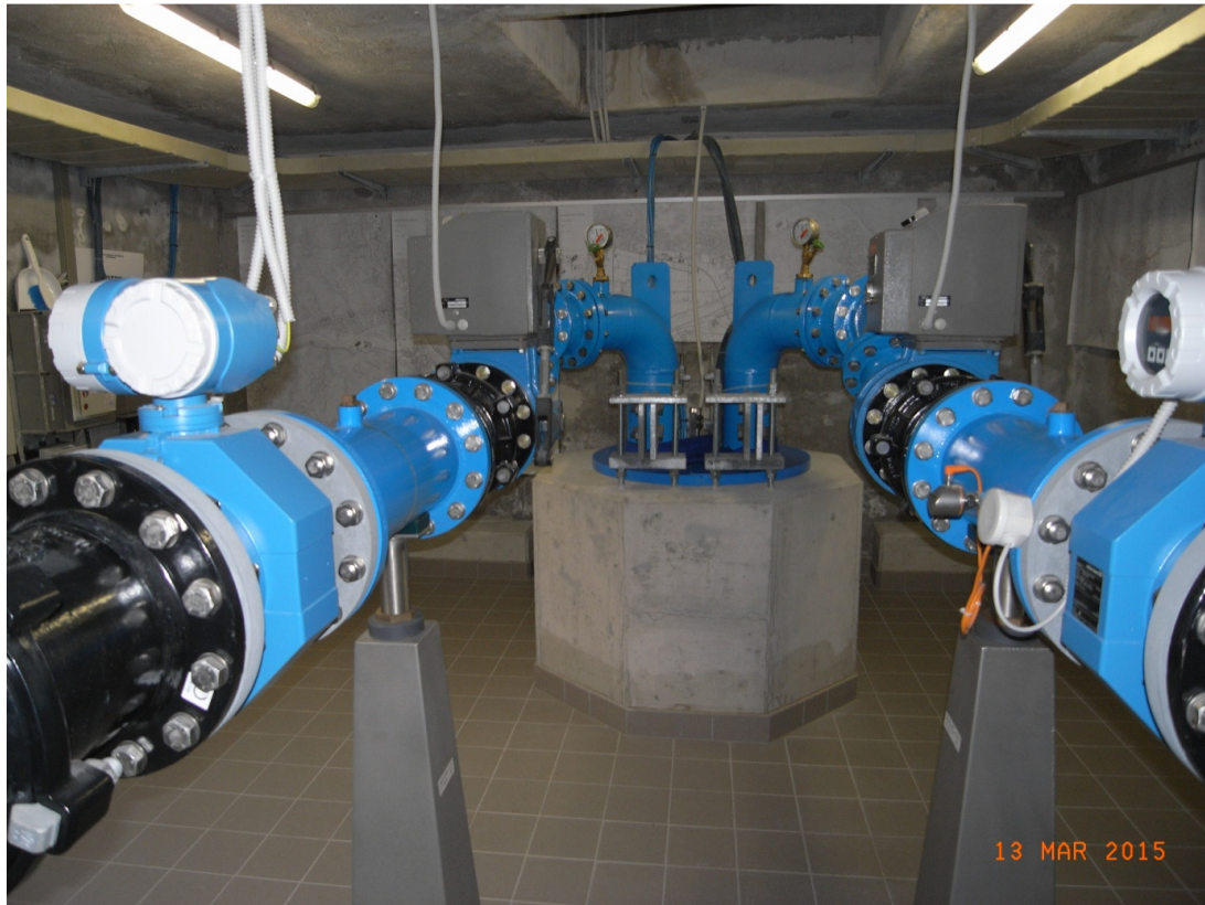
Fotografia stazione di pompaggio Morettina 2.