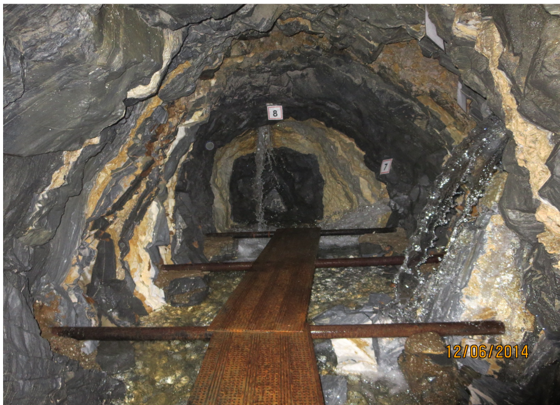
Fotografia sorgente di Remo.